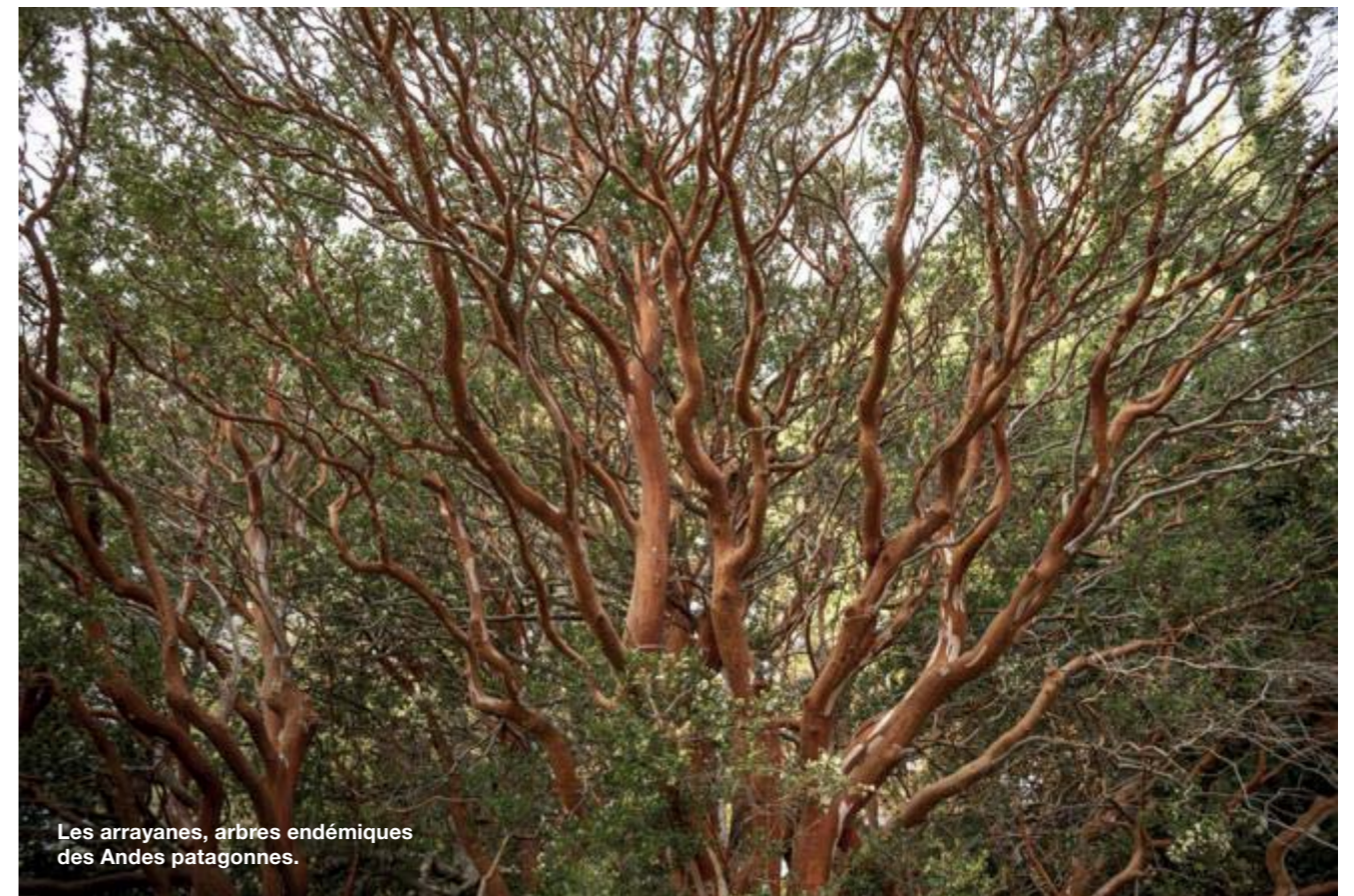
Les arrayanes, arbres endémiques des Andes patagones.