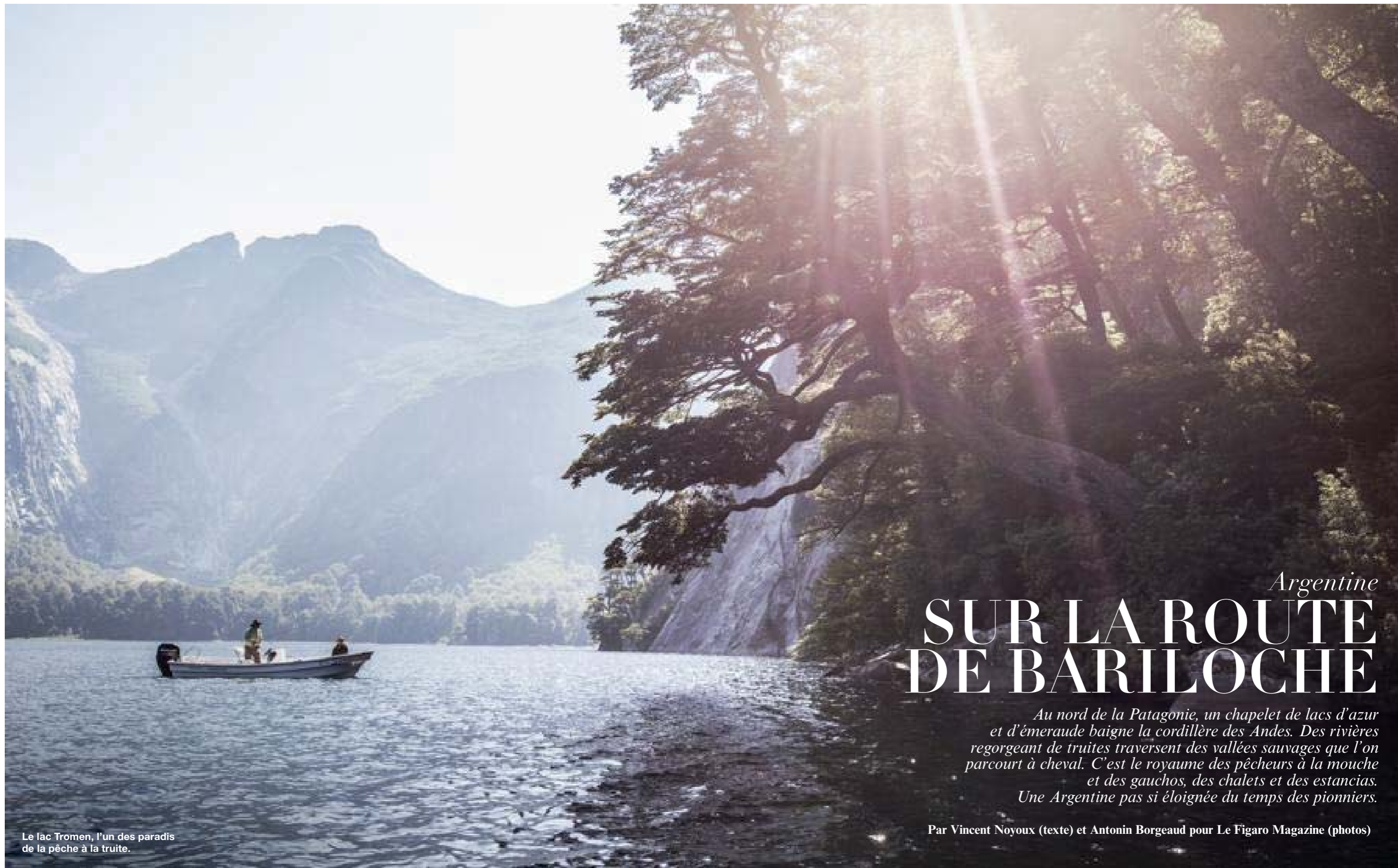
Le lac Tromen, l'un des paradis de la pêche à la truite.