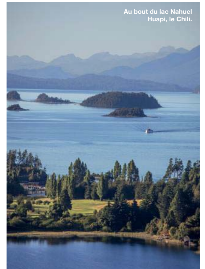
Au bout du lac Nahuel Huapi, le Chili.