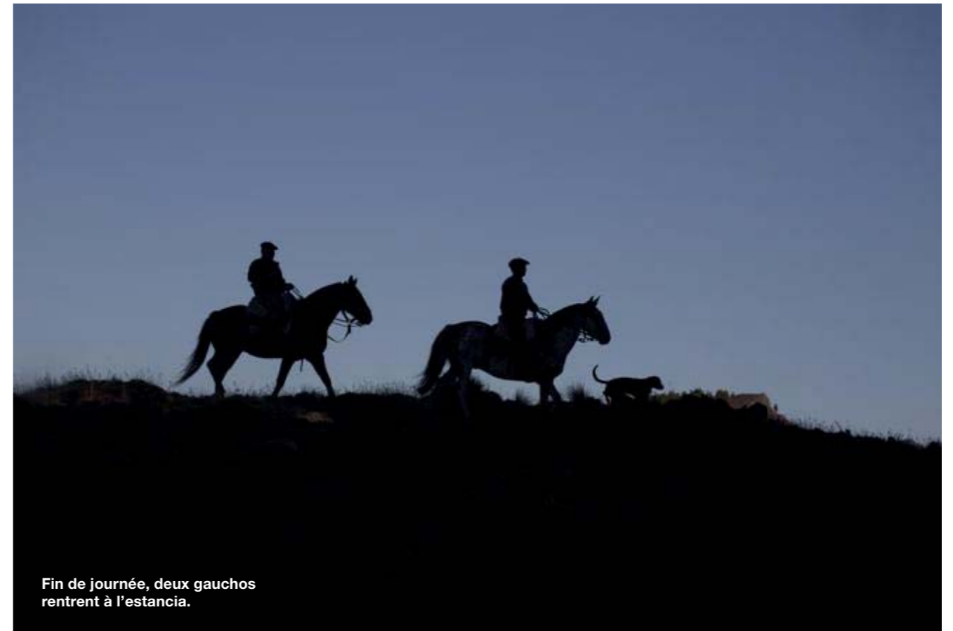
Fin de journée, deux gauchos rentrent à l'estancia.

L'atmosphère de villégiature alpine disparaît à mesure que l'on s'éloigne du Nahuel Huapi. On franchit d'abord le río Limay en passant devant la cahute où Butch Cassidy et le Kid, en pleine cavale, séjournèrent quelques jours avant de finir leur course en Bolivie. La route 237 s'enfonce ensuite dans un paysage de canyons et de promontoires rocheux dignes du Far West. C'est une autre Argentine qui apparaît. On imagine Butch Cassidy ou quelque évadé traversant à cheval le río Limay turquoise sous l'égide de cheminées sculptées par l'érosion. Bientôt, nous suivons une piste sur la gauche. Un portail s'ouvre, on passe des clôtures. L'air sent la poussière. Une vallée s'ouvre devant nous, bordée de falaises rocheuses, piquetée de buissons jaune-vert (neneo) et d'arbres joufflus (maitén). Nous pénétrons dans l'Estancia Arroyo Verde. Quatre mille hectares entre colline, lac et rivière, autant dire une miette comparée aux immenses estancias du reste du pays. Mais celle-ci fut fondée par une famille de sang français, les Larivière, et fut la première de Patagonie à ouvrir ses portes aux visiteurs. Élégante en