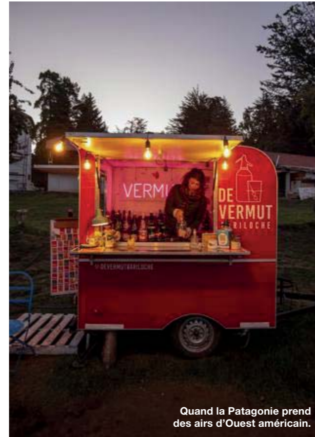
Quand la Patagonie prend des airs d'Ouest américain.