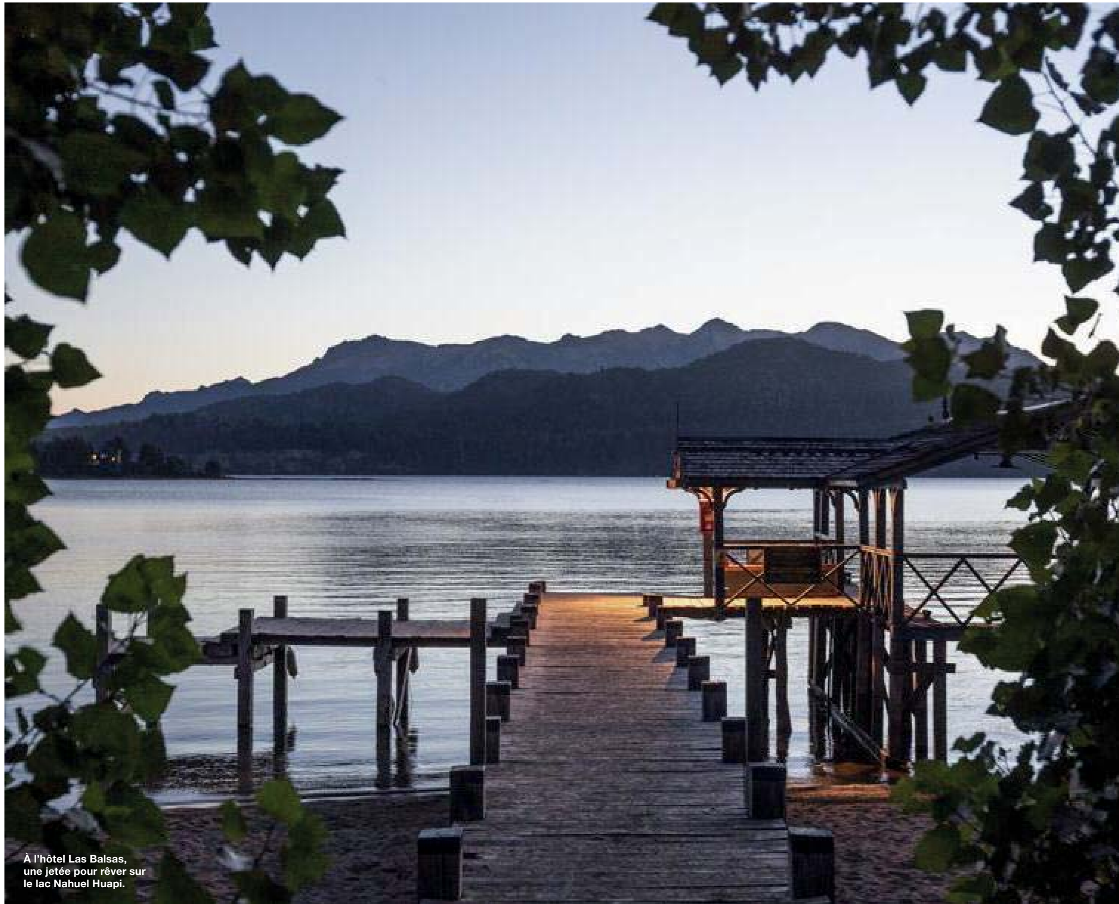
À l'hôtel Las Balsas, une jetée pour rêver sur le lac Nahuel Huapi.