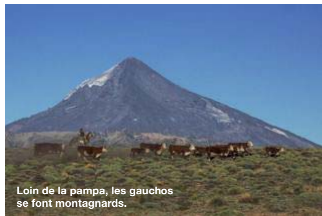
Loin de la pampa, les gauchos se font montagnards.